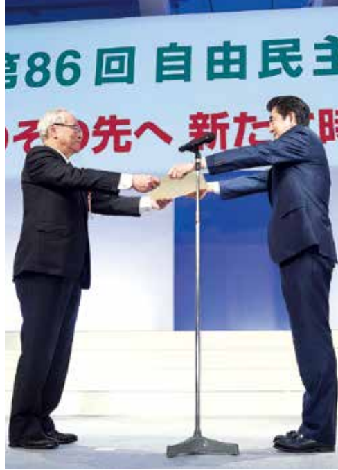
安倍晋三総裁から感謝状を受ける日医連横倉委員長