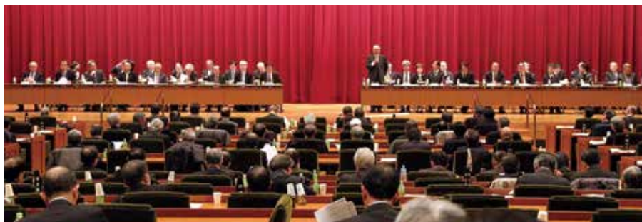
日医連執行委員会 (1月15日)

執行委員会終了後、日本医師会・日本医師連盟合同新年会が開催された。新年会には自民党の二階俊博幹事長、加藤勝信総務会長、甘利明選挙対策委員長、山口泰明組織運動本部長、田村憲久元厚生労働大臣、塩崎恭久元厚生労働大臣、大口善徳厚生労働副大臣、上野宏史・新谷正義両厚生労働大臣政務官ら、衆参の厚生労働関係議員、医師国会議員が来賓として多数出席し、祝辞を述べた。