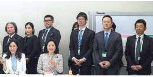
平成28年5月から「乳児用液体ミルクの普及を考える会」(呼びかけ人代表:野田聖子衆議院議員)で検討を進めてきた液体ミルクについて、平成31年1月31日、食品衛生法に基づく規格基準の厚生労働大臣承認がおりたため、2月7日に日本栄養士会災害支援チーム(JDA-DAT)「赤ちゃん防災プロジェクト」の進捗状況を含めて報告会を開催しました

日本医師連盟の先生方には、日頃より格別のご厚情を賜り、篤く御礼申し上げます。さて、厚生労働省が毎月勤労統計の調査を不適切な手法で実施し、その事実を隠蔽しようとしていたと疑われる問題が昨年末に発覚しました。国の政策立案のエビデンスとなる基幹統計に誤差が生じ、その結果、推計として二千万人を超える国民への雇用保険、労災保険、船員保