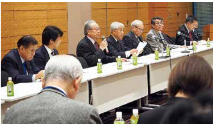
「医療基本法の制定にむけた議員連盟」設立総会にて趣旨説明

「医療基本法の制定にむけた議員連盟」設立総会にて趣旨説明。日本医師会の委員会や厚生労働省の検討会においてもさまざまな課題についての議論がなされておりますが、政権与党としての意見の取りまとめに、正直頭を痛めているのが現状であります。「医師の健康への配慮」「地域医療の継続性」の二つが両立する結論を得なければなりません。これは働く上、限時間の問題だけでなく、さまざまな課題が密接に絡み合っているということが、地域医療を懸命に守って