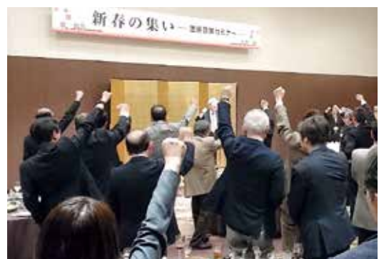
富山県医師会にてガンパローコール