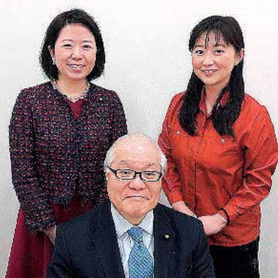
ラジオ番組の収録。ゲストに高橋孝雄日本小児科学会会長(ニッポン放送1月13日~ / KBCラジオ1月19日~)、武見敬三参議院議員(ニッポン放送2月24日~ / KBCラジオ3月2日~)をお迎えして