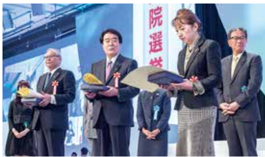
自民党表彰式（表彰者）