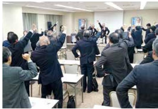
奈良県医師連盟にてガンパローコール