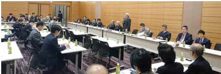
「医療基本法の制定にむけた議員連盟」で挨拶する横倉委員長(日医会長)2月6日