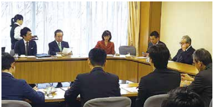
全世代型社会保障改革ビジョン検討PT役員会にて

「医療基本法の制定にむけた議員連盟」設立総会にて趣旨説明。日本医師会の委員会や厚生労働省の検討会においてもさまざまな課題についての議論がなされておりますが、政権与党としての意見の取りまとめに、正直頭を痛めているのが現状であります。「医師の健康への配慮」「地域医療の継続性」の二つが両立する結論を得なければなりません。これは働く上、限時間の問題だけでなく、さまざまな課題が密接に絡み合っているということが、地域医療を懸命に守って