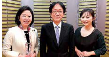
ラジオ番組の収録。ゲストに高橋孝雄日本小児科学会会長(ニッポン放送1月13日~ / KBCラジオ1月19日~)、武見敬三参議院議員(ニッポン放送2月24日~ / KBCラジオ3月2日~)をお迎えして