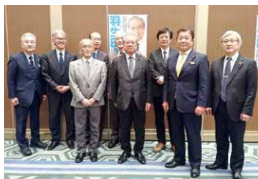
石川県医師会役員の方と

昨年七月に日本医師連盟の推薦を賜り、その後自民党の全国比例区にて公認を受け、以来全国を回らせていただき、ご支援の輪を広げさせていただいてお申し上げます。何卒、引き続き皆さまのご指導ご支援を賜りますようお願い申し上げます。